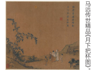
马远传世精品《月下把杯图》。

这一诗一词都是发泄心中不爽，并借以咏志。就是这首诗，引来一场官司，让众多的梁山好汉，闹出一场奔赴江州劫法场的一系列故事，让世人知道九江有座浔阳楼。