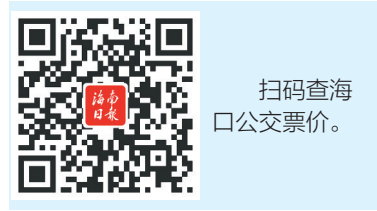
扫码查海口公交票价。

特定线路优惠人群凭“天涯英才卡”可免费乘坐游1、游2、游5、游6、观光1、59大环线、J1、J2、J3、J4、68路、45路、44路、43路、35区间、35路、28路、21路、19路、4路。