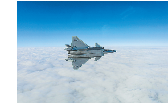
空军歼-20飞机进行飞行训练。

新华社北京8月31日电（记者刘济美）第十三届中国航展将于9月28日至10月3日在广东省珠海市举行。中国空军新闻发言人申进科在8月31日召开的中国航展新闻发布会上表示，中国空军历史性地跨入战略空军门槛，将在第十三届中国航展上集中展现空军推进战略转型、迈向世界一流的新成就。