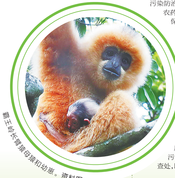
霸王岭长臂猿母婴和幼崽。