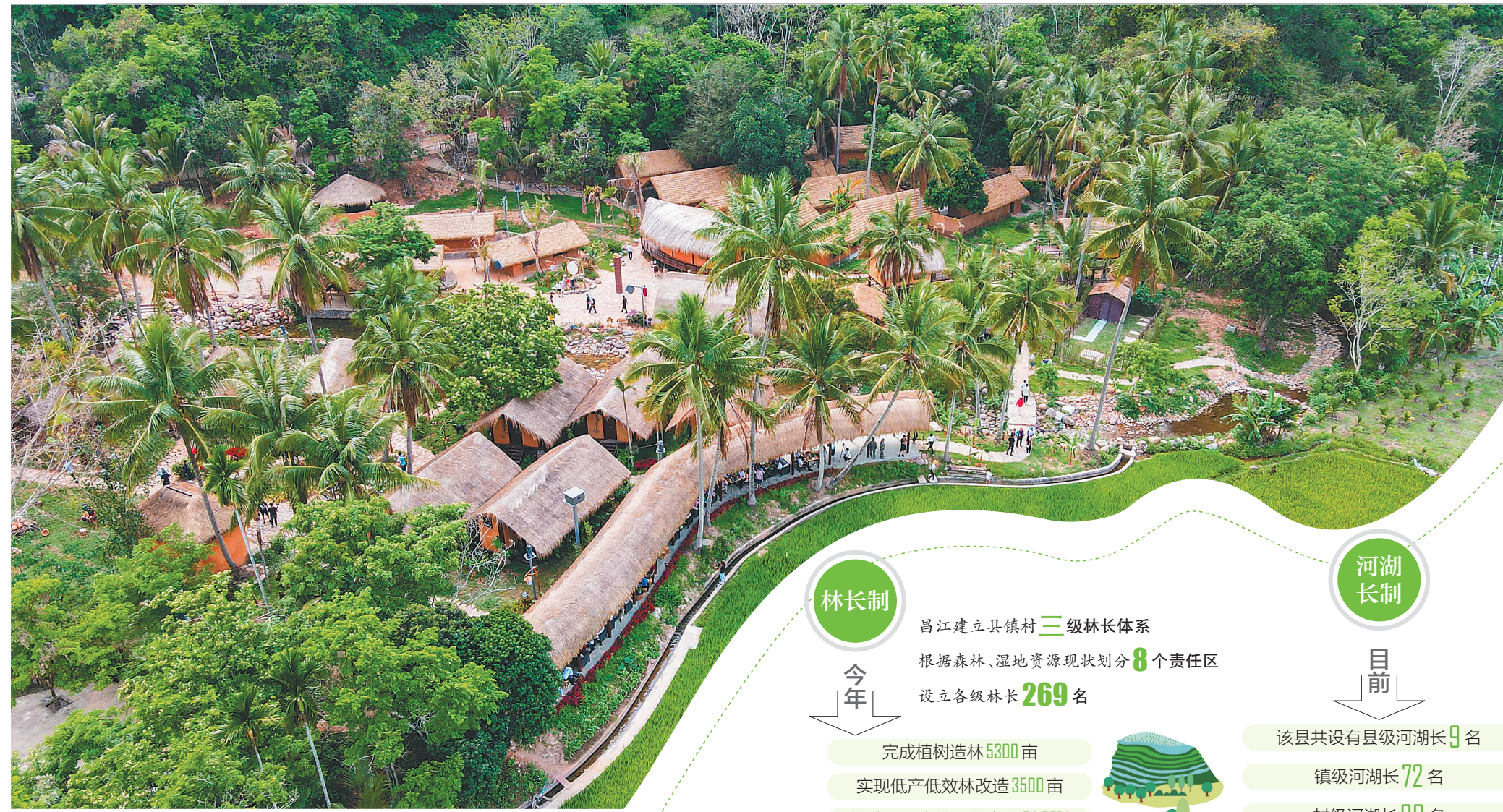
昌江王下乡洪水村。