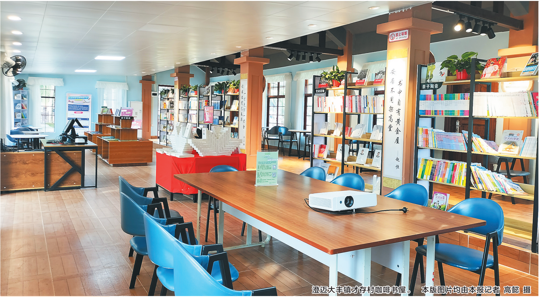
澄迈大丰镇才存村咖啡书屋。