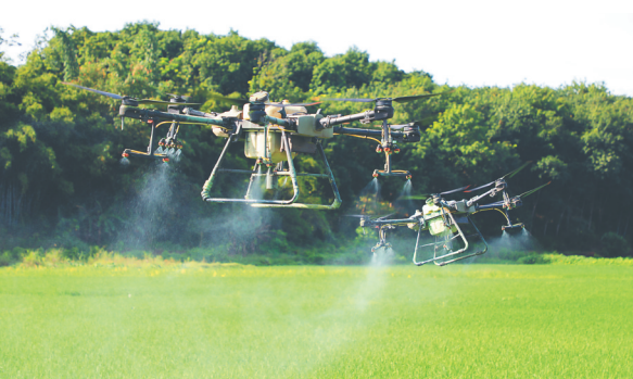
植保无人机“飞防”作业。

本报牙叉9月5日电(记者曾毓慧 通讯员彭信翔 钟起鑫)9月3日，白沙黎族自治县在打安镇福安村打炳坡田洋启动2021年农业生产和水利救灾资金(第一批)项目，现场通过植保无人机“飞防”作业，助力当地农户防治水稻病虫害。