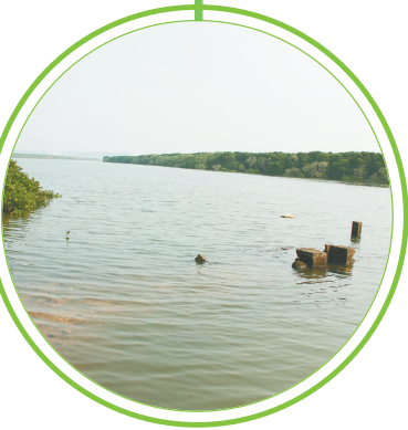
塔市下南洋古渡口。

据1988年续修的《林氏族谱》，雷顺塔的建造者僧无我，是元代名僧，今海口市桂林洋高山村人，俗名林藩龙。