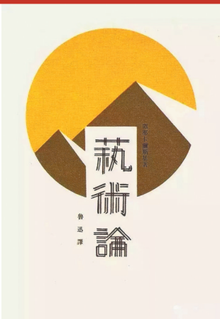
鲁迅先生设计的封面。