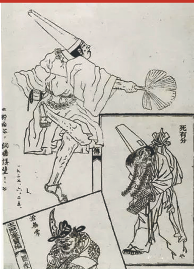
鲁迅先生为《朝花夕拾》设计的插图。

当时，儿童艺术展览是由社会教育司主持的，司长自然要亲自过问，然而，具体操办便是主管图书馆、美术的第一科科长周树人来做了。