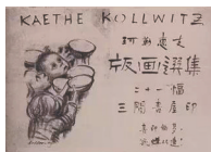
鲁迅先生设计的广告。