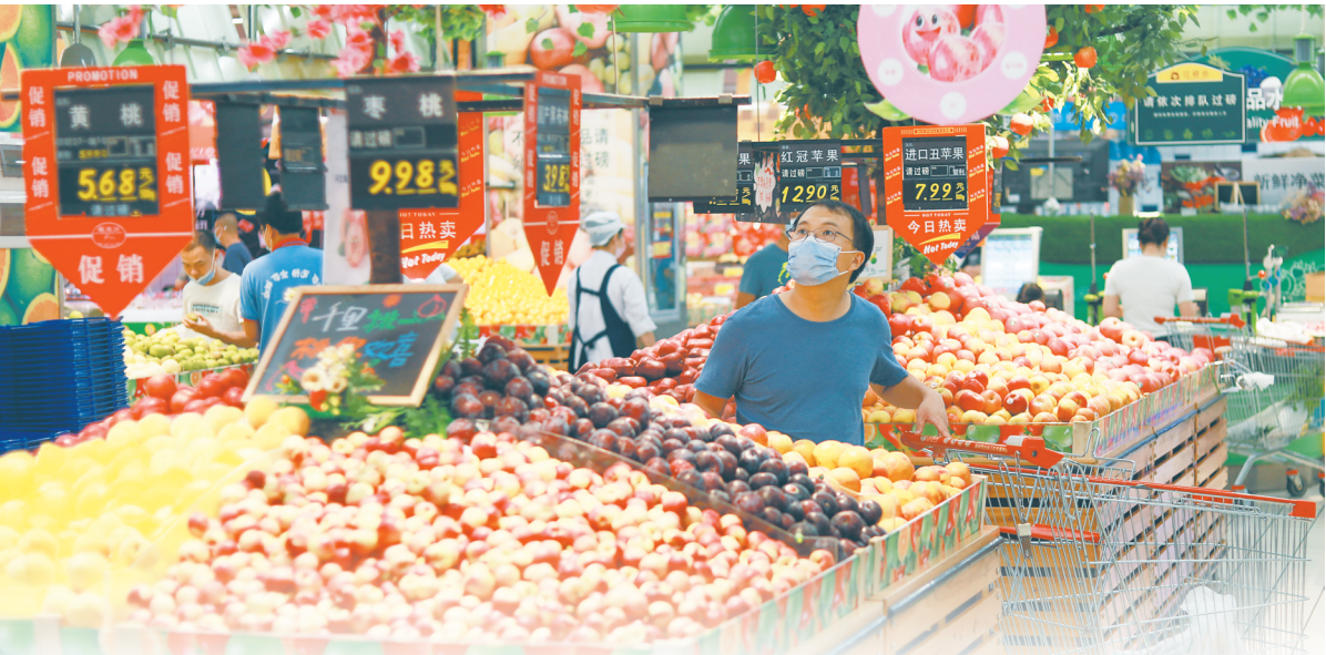
近日,在海口大润发龙昆南店,市民选购水果。