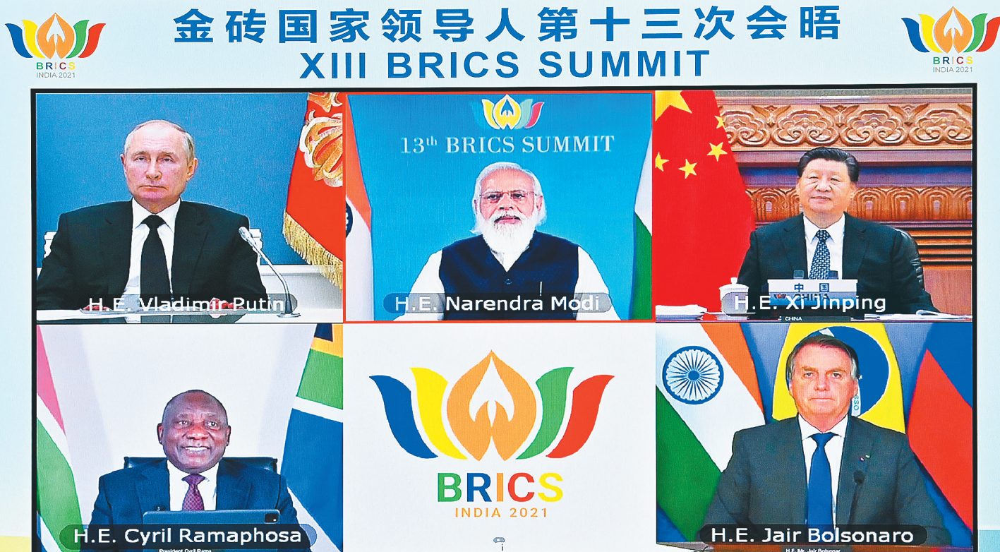
9月9日晚,金砖国家领导人第十三次会晤以视频方式举行。国家主席习近平在北京出席会晤并发表重要讲话。南非总统拉马福萨、巴西总统博索纳罗、俄罗斯总统普京出席,印度总理莫迪主持会议。