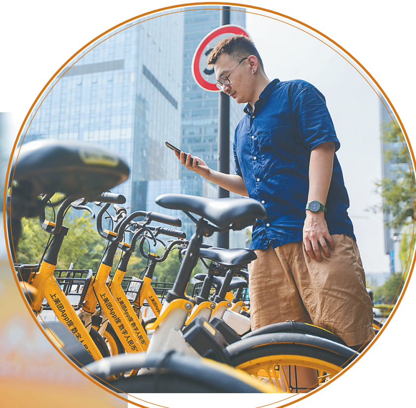
海口市民扫码骑美团共享单车。