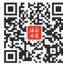
扫码阅读行动计划全文

度参与联合国人权机制工作,推动建设更加公平合理包容的全球人权治理体系,共同构建人类命运共同体。