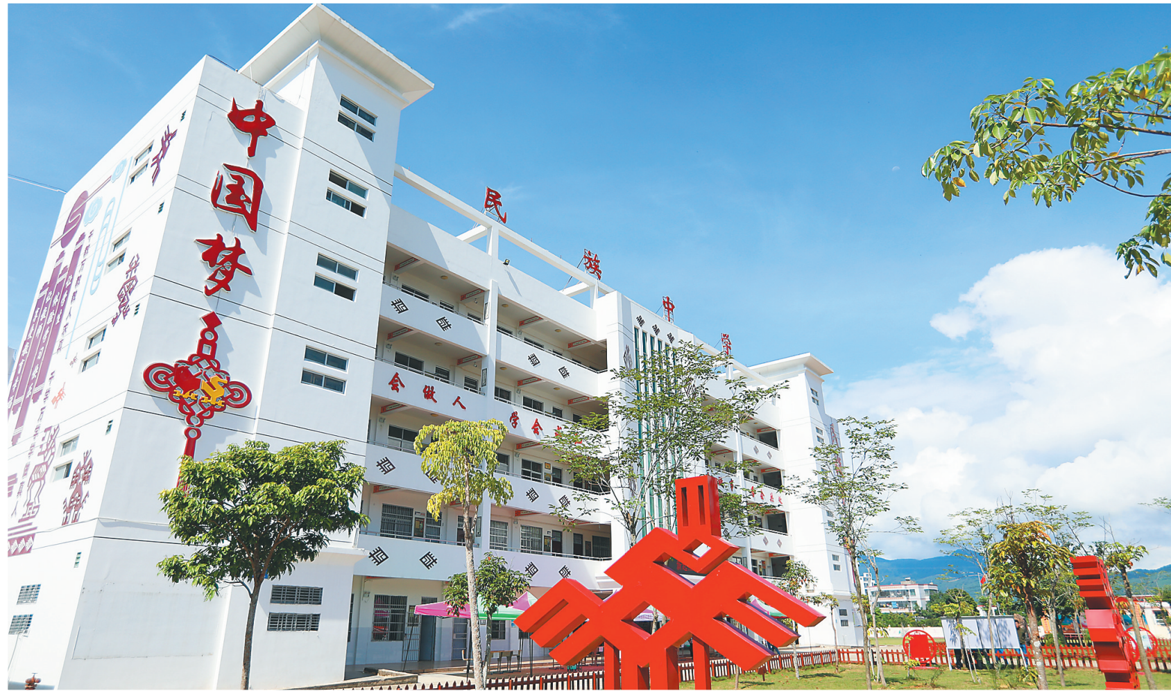
白沙民族中学校园外景。

“桃李不言,下自成蹊。”近年来,白沙以“办好人民满意的教育”为宗旨,落实“立德树人”为根本任务,积极推动各项教育事业发展,通过统筹推进各级教育工作,积极改善办学条件、深入开展合作办学、强化教师队伍建设、加强控辍保学等,有效提升了白沙整体的教学质量和办学水平,促进白沙教育事业健康、持续发展。