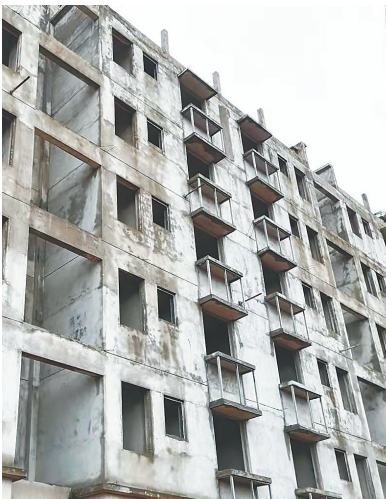
↑9月8日,临高县临城镇大坡小区,廉租房(一期)楼体外有多处黑色污渍。 ↓廉租房楼体后面杂草丛生。