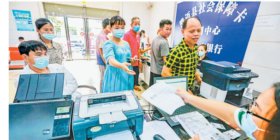
在澄迈社保卡“一卡通”中心，工作人员为群众办理业务。