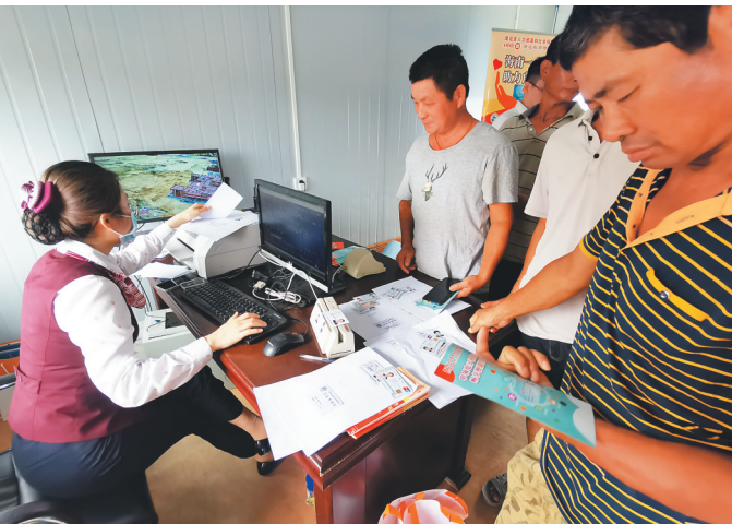
工作人员在工地为工人激活社保卡。