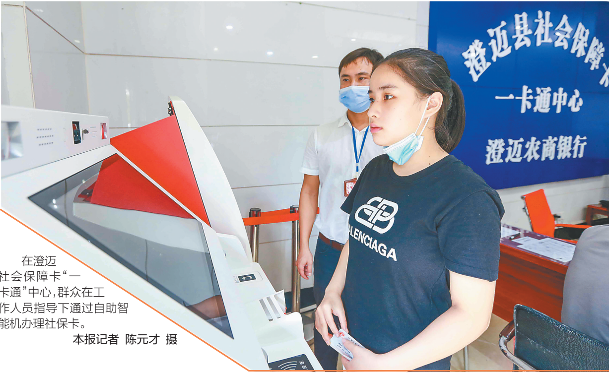
在澄迈社会保障卡“一卡通”中心，群众在工作人员指导下通过自助智能机办理社保卡。