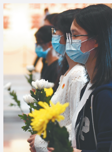
9月18日,各界群众来到中国人民抗日战争纪念馆向抗战英烈献花。