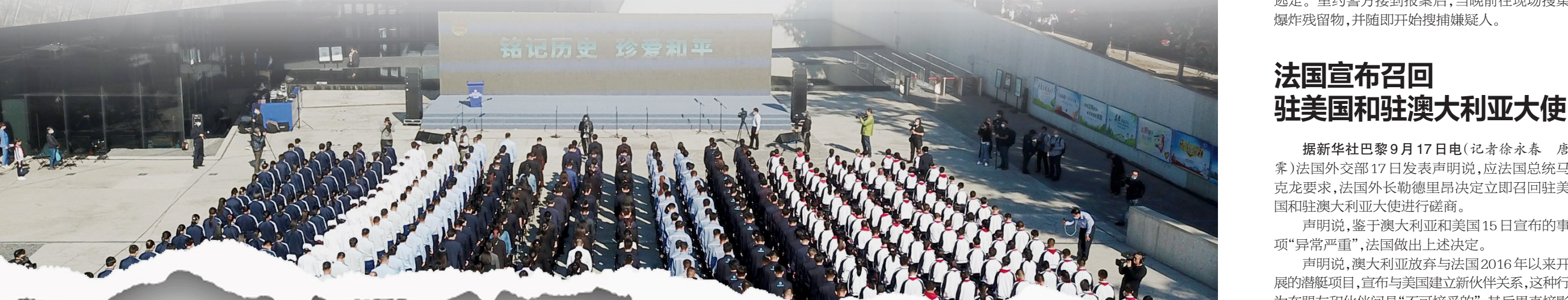
9月18日,在位于哈尔滨的侵华日军第七三一部队罪证陈列馆广场,人们参加纪念九一八事变爆发90周年活动。

声明说,澳大利亚放弃与法国2016年以来开展的潜艇项目,宣布与美国建立新伙伴关系,这种行为在盟友和伙伴间是“不可接受的”,其后果直接影响到法国“我们之间的盟友和伙伴关系”的看法。