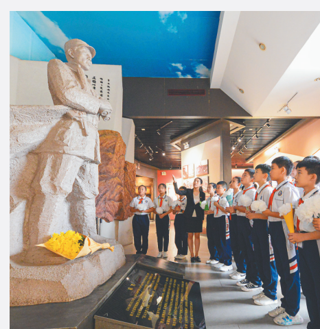
9月17日,小学生在晋冀鲁豫烈士陵园左权将军纪念馆参观。