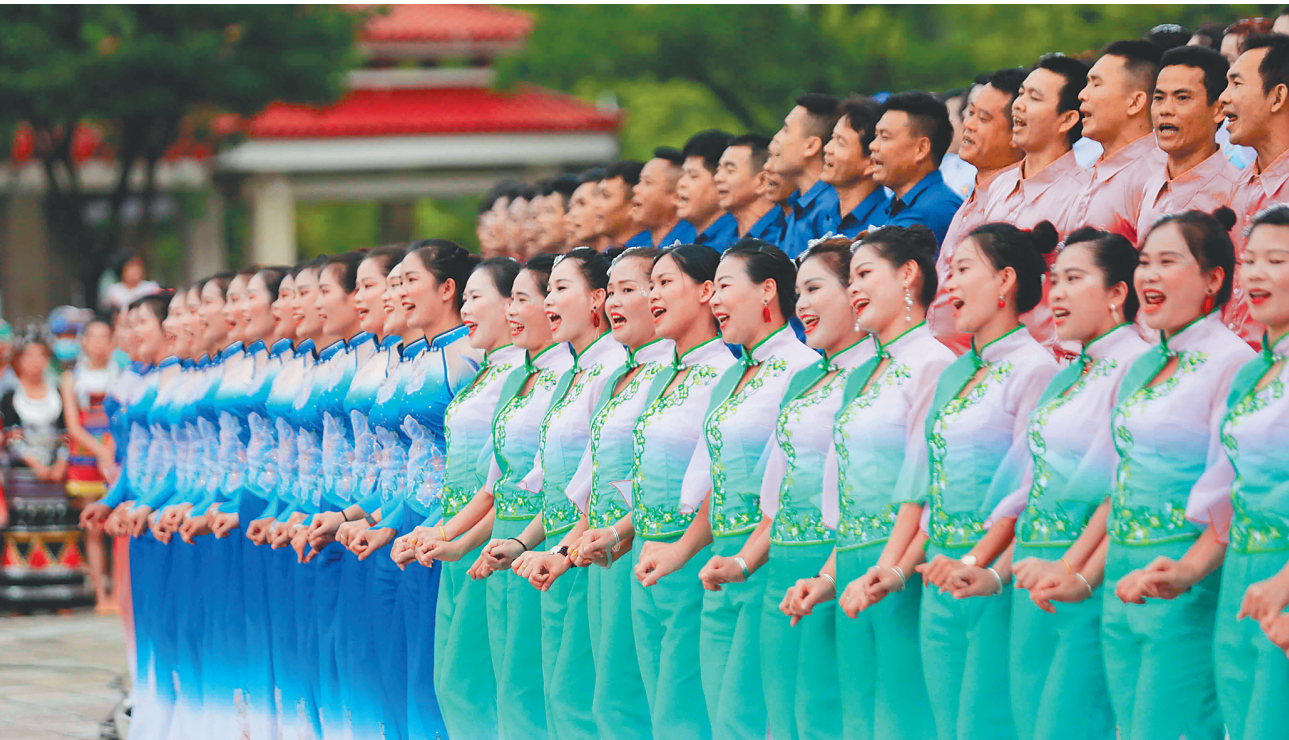
9月23日,“中国农民丰收节”海南庆祝活动在儋州市文化广场举行,本次活动以“庆丰收 感党恩”为主题。图为在当天举办的“千人调声颂党恩”农民丰收歌会上,农民朋友们通过调声表达丰收喜悦。