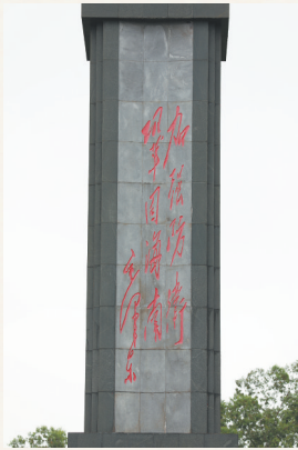
华南公路工程修建烈士纪念碑上的毛泽东题词。