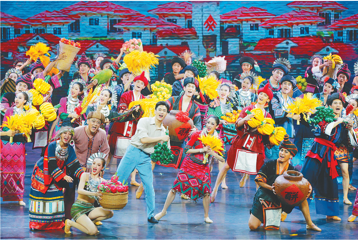
《锦绣家园》剧照。

贸港首批100个人才团队的“蒙麓光艺术团队”为主要创作班底，邀请部分主创、主演和几家参演单位参加。