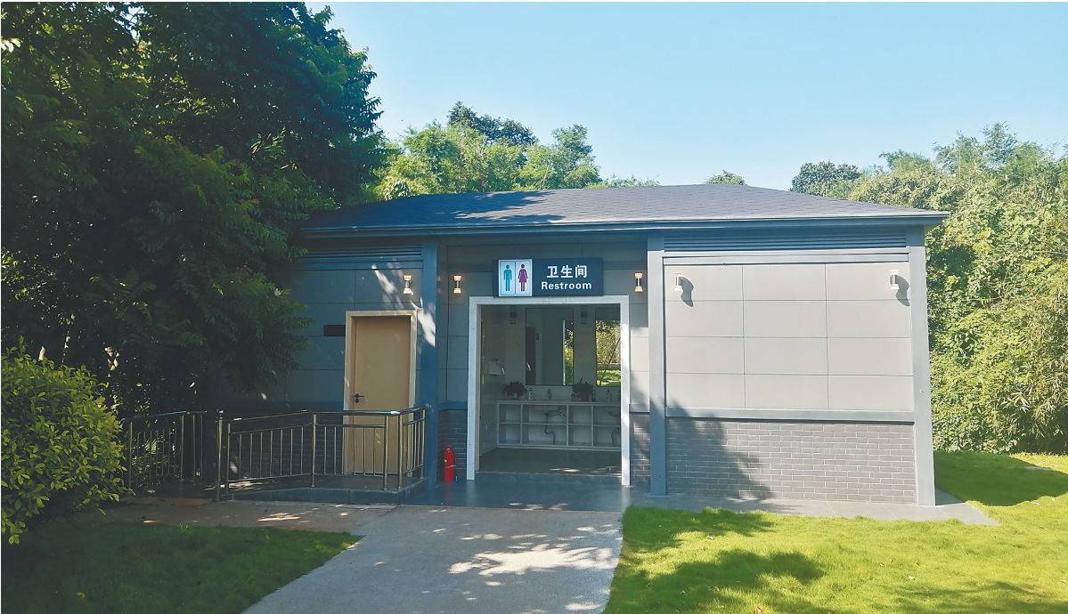
海口演丰镇瑶城村公共厕所。