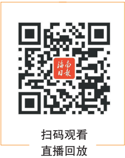
扫码观看直播回放

生活预防方面,保证居室内空气流通,勤洗手,戴口罩,均衡营养,加强体育锻炼,合理使用抗生素以及积极治疗基础疾病、少去人群密集场所等都是预防肺炎的有效手段,而接种肺炎疫苗可以有效预防肺炎球菌引起的肺炎。