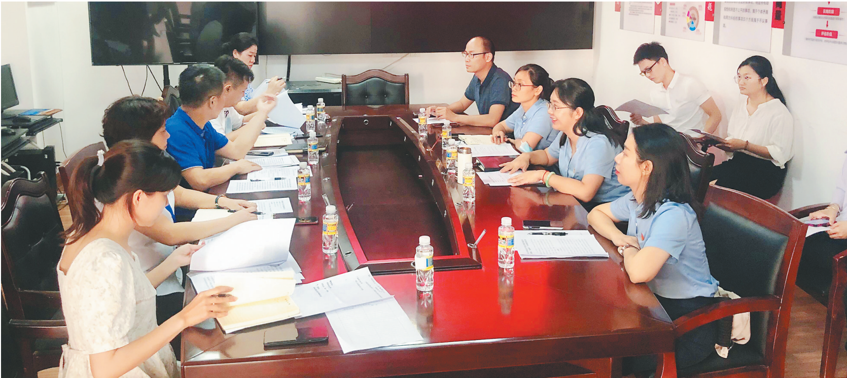
海口秀英区行政审批局与西秀镇举行“直通联办”调研座谈会。

今年8月,省委印发了《中共海南省委关于坚持以党建引领海南自由贸易港建设的意见》,要求着力发挥好党建在自由贸易港建设中引领方向、改革创新、攻坚克难、服务保障的作用。9月27日召开的省优化营商环境工作专班第四次会议中也提出,要树立“整体政府”理念,要求各部门要各司其职、通力协作,以更大步伐加快打造一流营商环境。 海口市秀英区委、区政府高度重视,对标新精神,成立城市运行联动指挥中心,推出“12345直通联办系统”,启动“直通联办”工作机制试运行,以“一通四办”智治先行,提高基层治理水平。