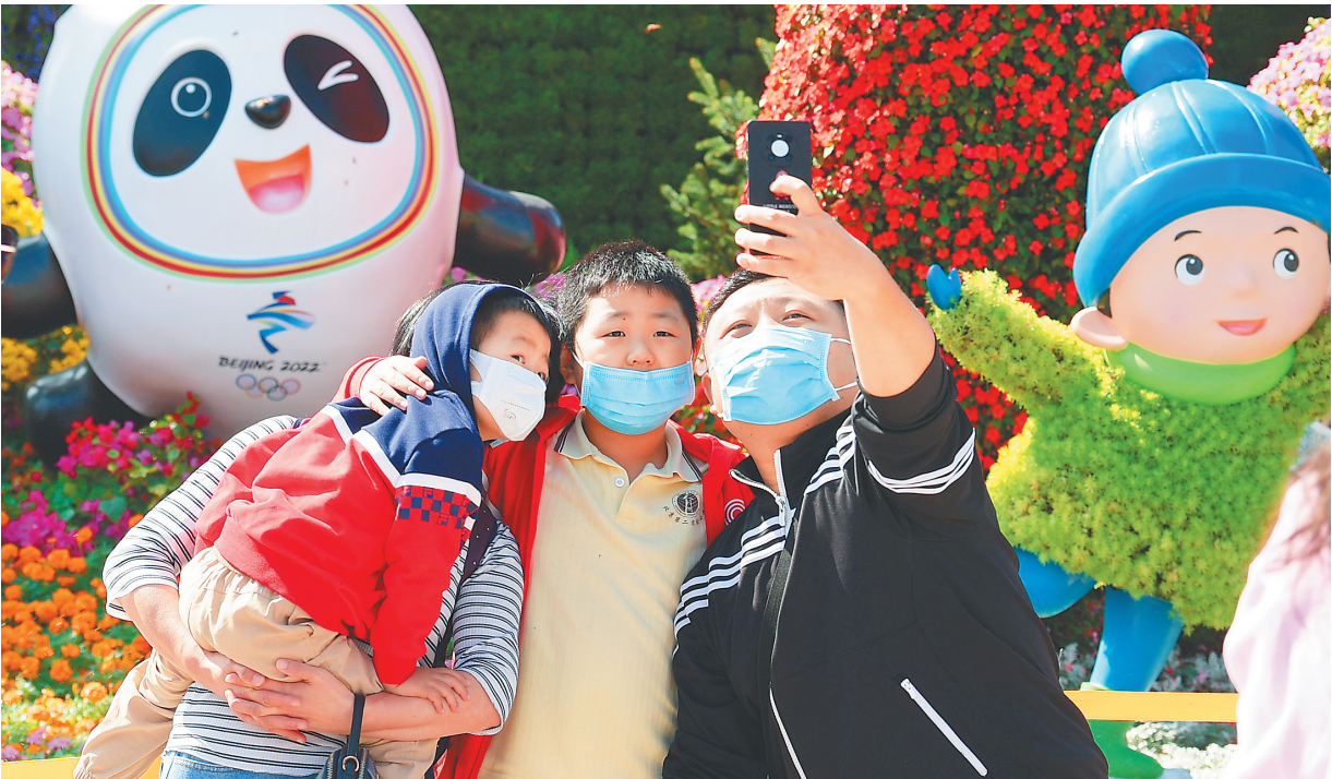
国庆黄金周期间，游人在北京长安街西单路口“喜迎冬奥”主题花坛前拍照留影。

色景区接待游客超7万人次；假期前三天，井冈山景区接待游客13.05万人次，比2019年同期增长9.66%…… 这是全面建成小康社会后的第一个国庆黄金周，绿色乡村游“圈粉”无数—— 达东村位于拉萨近郊，这里交通便利、风光秀美，被誉为拉萨“最美乡村”，是西藏自治区首批绿色旅游示范基地。“入秋后，天气转凉，村里的温泉民宿，已经预订到节后了。”达东村乡村旅游项目经理多明兰介绍，国庆前三天，全村共接待游客约1900人次，其中本地游客占80%左右。 飞猪数据显示，假期前三天，乡村民宿订单量环比上月增长超560%，增速超过酒店。