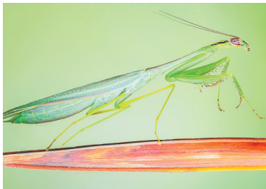
海南纤柔螳。