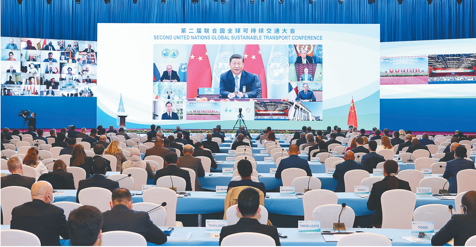
10月14日晚,国家主席习近平以视频方式出席第二届联合国全球可持续交通大会开幕式并发表题为《与世界相交 与时代相通 在可持续发展道路上阔步前行》的主旨讲话。

新华社北京10月14日电 国家主席习近平14日晚以视频方式出席第二届联合国全球可持续交通大会开幕式并发表题为《与世界相交 与时代相通 在可持续发展道路上阔步前行》的主旨讲话。