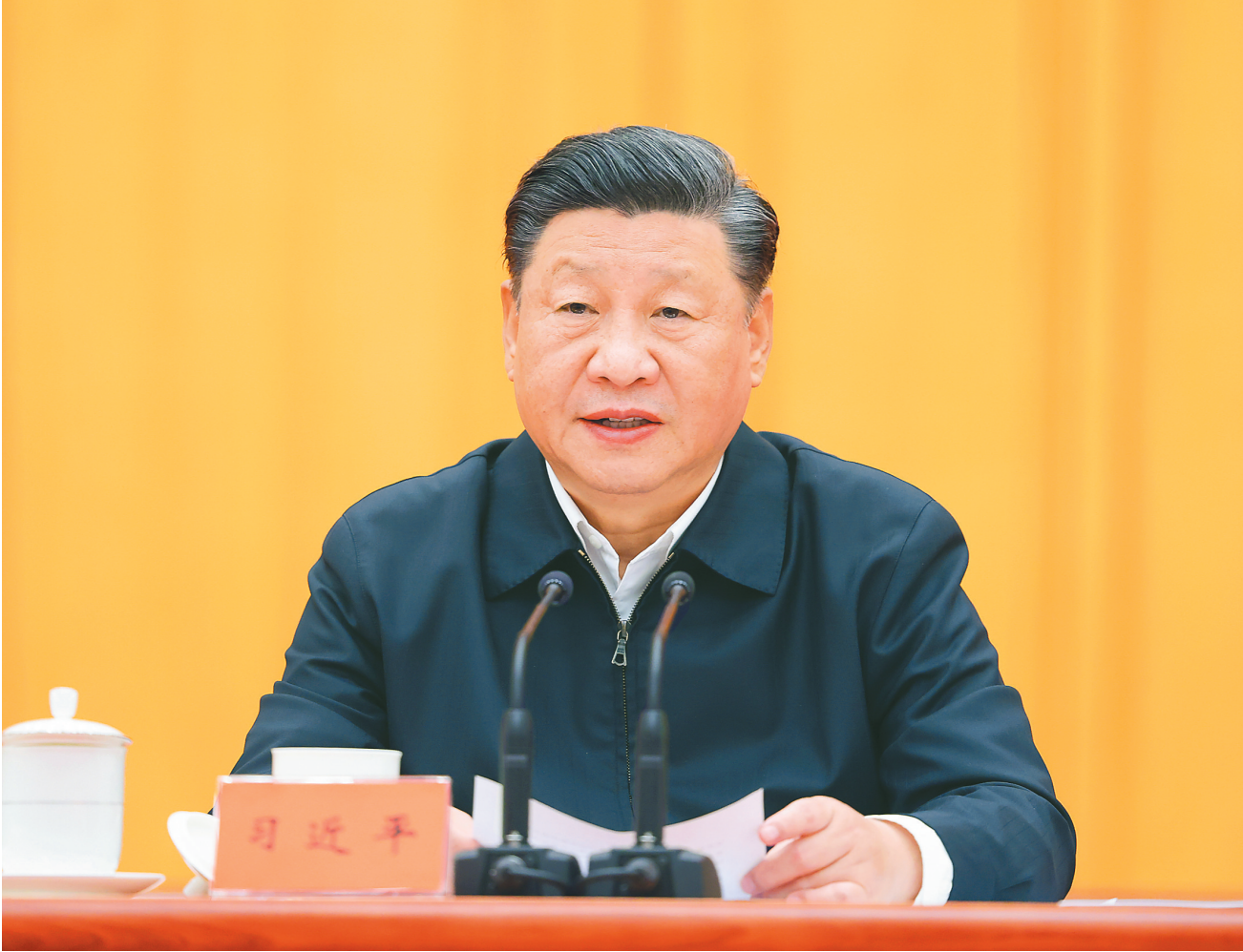
10月13日至14日,中央人大工作会议在北京召开。中共中央总书记、国家主席、中央军委主席习近平出席会议并发表重要讲话。

习近平指出,当今世界正经历百年未有之大变局,制度竞争是综合国力竞争的重要方面,制度优势是一个国家赢得战略主动的重要优势。历史和现实都表明,制度稳则国家稳,制度强则国家强。我们要毫不动摇坚持、与时俱进完善人民代表大会制度,加强和改进新时代人大工作。