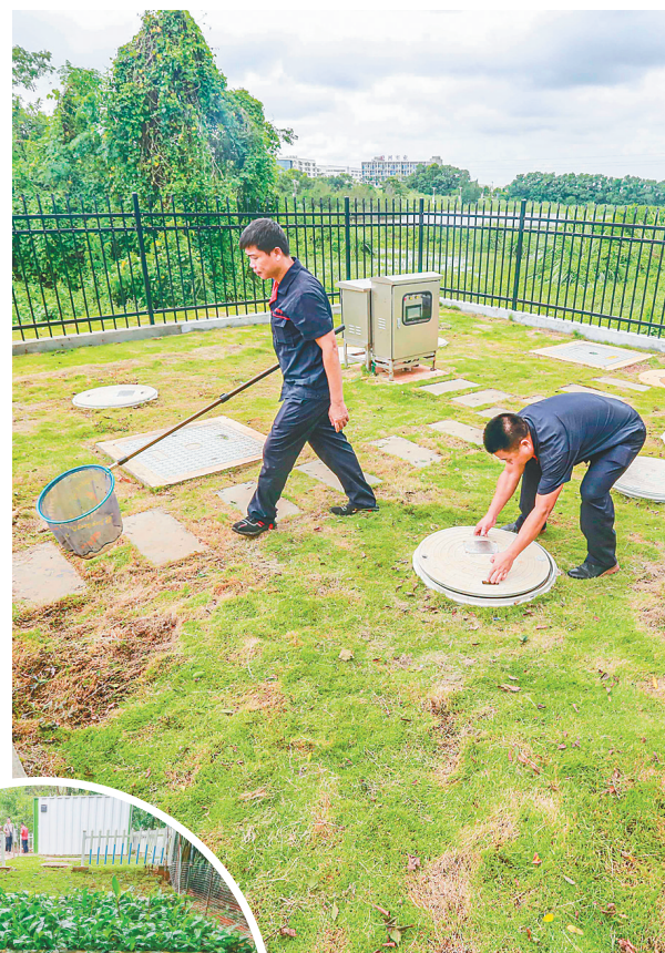
↑在澄迈县大丰镇大丰村农村生活污水处理厂,工作人员巡查地理一体化污水处理站运行状况。