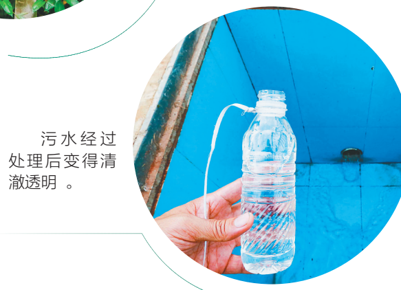
污水经过处理后变得清澈透明。