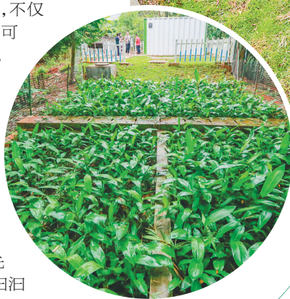
↓澄迈县福山镇红光居前进队美人蕉人工湿地。