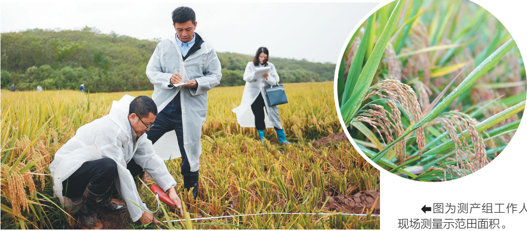
↑图为待收割的水稻。

据了解，第三代杂交水稻技术被袁隆平院士看作是突破亩产“天花板”的关键。2019年起，衡南县被选定为第三代杂交水稻核心示范区，第三代杂交水稻组合“叁优一号”在示范基地开展高产攻关试验示范。