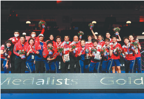
图为10月17日，中国队在颁奖仪式后合影。

据新华社丹麦奥胡斯10月16日电（记者刘咏 林晶）16日在尤伯杯羽毛球团体赛决赛上，中国队在先失一分的情况下，连扳三场，以3:1战胜日本队，第15次捧起尤伯杯。