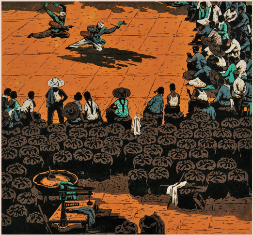
《打麦场上》(套色木刻) 张祯麒