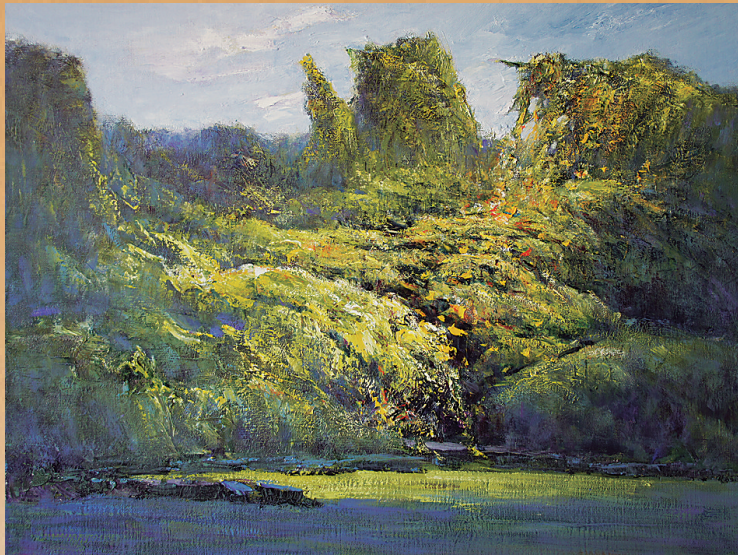
《雨林·金秋》(油画) 刘运良