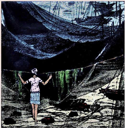
《海角激情》(版画) 杜鸿年