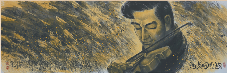
《怒吼吧,黄河!》(国画) 易至群