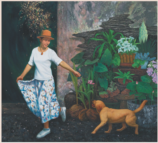
《南方的春天》(综合材料) 王锐