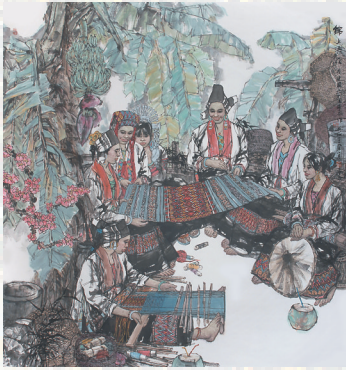
《锦上添花》(国画) 齐英石