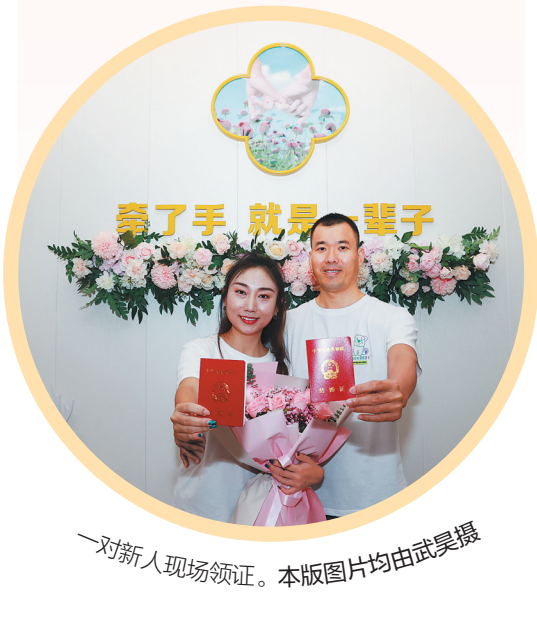
一对新人现场领证。