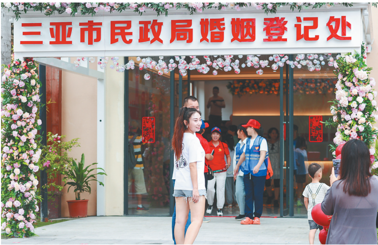
三亚市民政局婚姻登记处。