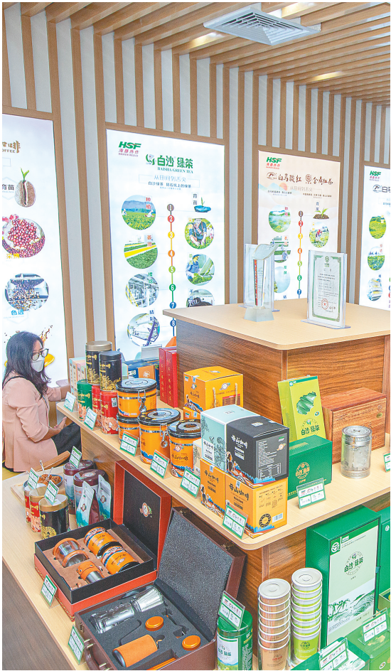
海南农垦热作产业集团有限公司旗下首家直营的母山咖啡馆在海口开业。

近日，海南省农垦投资控股集团有限公司（以下简称海垦控股集团）在海口举行经营分析会，交出前三季度成绩单：1月至9月，海垦控股集团实现汇总营业收入179.76亿元，同比增长10.5%，利润总额6.57亿元，同比增长33.2%，经营状况总体平稳、稳中有进的态势进一步显现。 与此同时，在新旧动能转化、深化国企改革、垦地融合发展等多个维度上，海垦控股集团或实现可喜突破，或保持稳步增长，一项项有力举措直观反映出海南农垦的发展“热度”和“速度”。