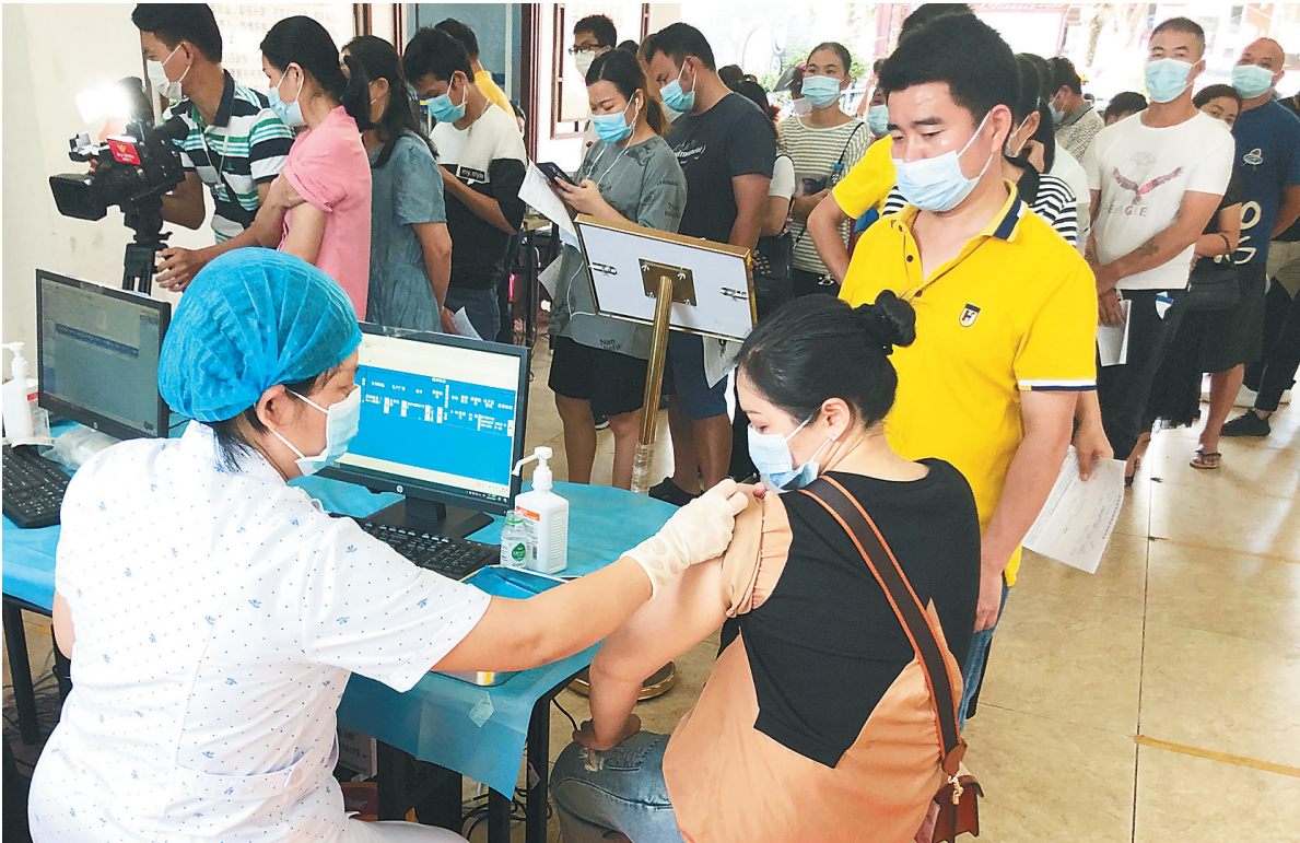
海口秀英区在水头村设置加强针临时接种点,让村民在家门口就可以接种疫苗。

具体服务时间安排上,龙华区得胜沙社区卫生服务中心、滨海公园社区卫生服务中心、龙昆中心社区卫生服务中心、金贸社区卫生服务中心、金宇社区卫生服务中心、滨涯社区卫生服务中心、四季华庭社区卫生服务中心、高坡社区卫生服务中心等8个单位接种新冠疫苗的具体时间为8:30—11:30以及14:30—21:00。其他接种单位接种新冠疫苗具体时间为上午8:30—11:30以及14:30—17:30。