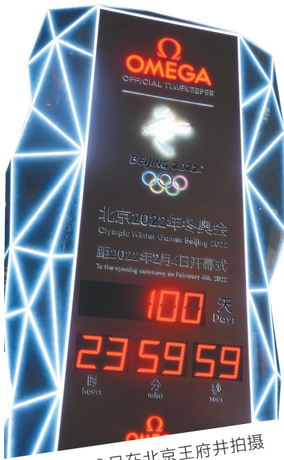
10月26日在北京王府井拍摄的北京冬奥会倒计时牌。

新华社北京10月26日电 北京2022年冬奥会开幕倒计时100天主题活动10月26日在京隆重举行。中共中央政治局常委、国务院副总理、第24届冬奥会工作领导小组组长韩正出席活动，并发布北京冬奥会奖牌“同心”。