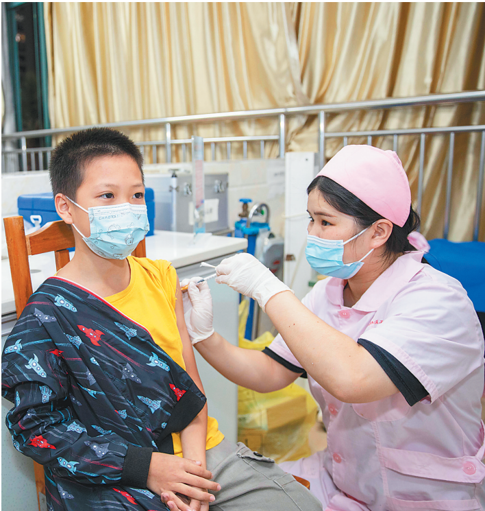
家长孩子一起打疫苗

10月28日晚，在海口龙华区金盘社区卫生服务站，一位家长和10岁的孩子一同接种新冠疫苗。日前，海口市已全面启动3岁~11岁人群新冠疫苗接种工作，接种点均延长至21时下班。不少家长在晚上带孩子到接种点，除了让孩子接种第一剂新冠疫苗外，家长也积极接种新冠疫苗加强针。