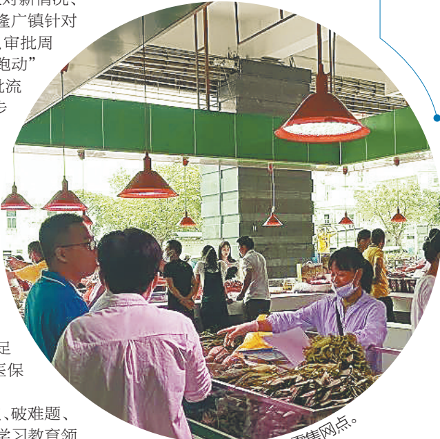
陵水平价蔬菜零售网点。

随着深入推进作风整顿建设工作,陵水全县干部的工作作风持续得到改善。进一步激发了全县干部群众积极投身于海南自由贸易港建设大局的热情和动力,有效助推陵水县经济社会高质量发展。