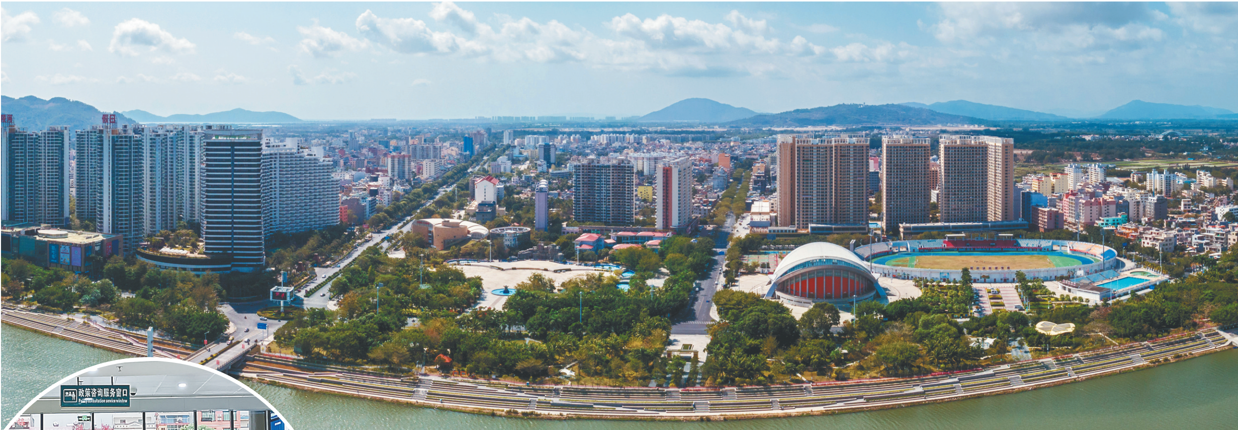
陵水县城新貌。