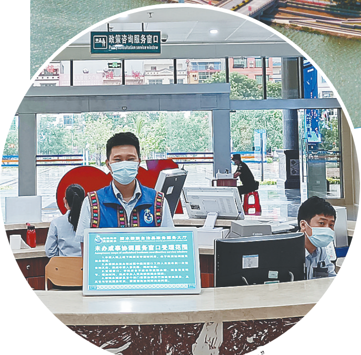
陵水设立“未办成事协调服务窗口”。