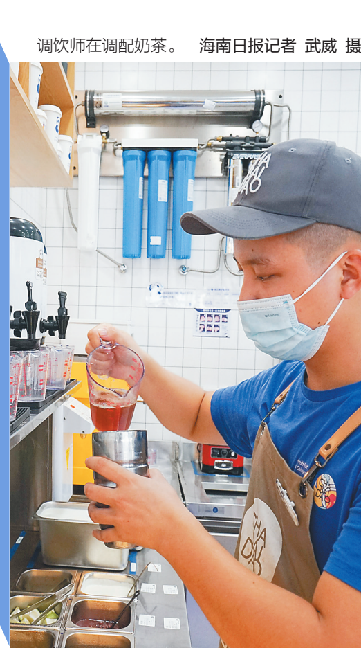
调饮师在调配奶茶。

“铁饭碗”不再是年轻人的唯一目标,涌现出许多“斜杠青年”,他们不再满足“专一职业”生活方式,选择尝试多种可能,遇见更多层次的自己。“90后”余小月是一名护士,工作时她是体贴细心的白衣天使,下班后她扛起三脚架、相机,当起网络博主,为大家推荐好吃的、好玩的。