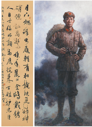
展出的书画作品《琼崖革命 的旗帜——冯白驹》。