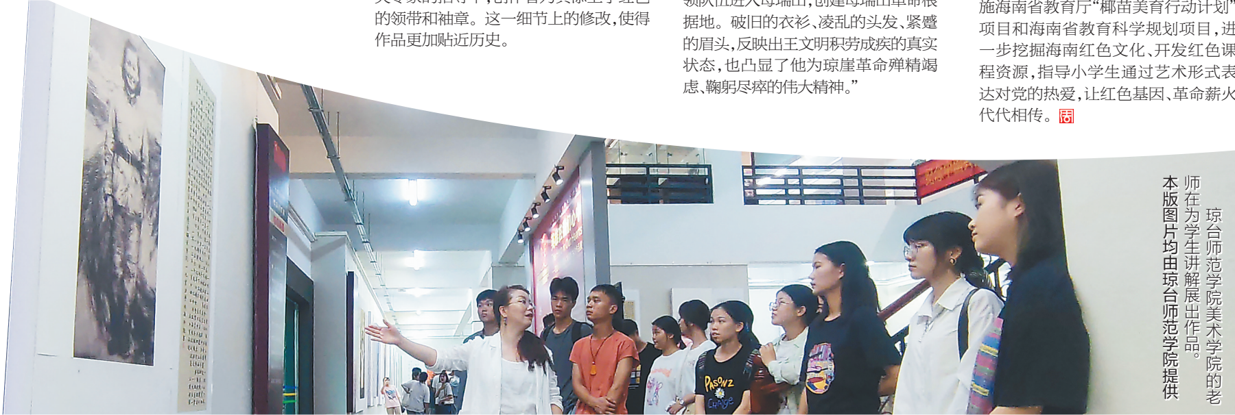
琼台师范学院美术学院的老 师在为学生讲解展出作品。

他举例说,在最初的素描稿上,琼崖革命先驱陈永芹身着素色军装,后来在有关专家的指导下,创作者为其添上了红色的领带和袖章。这一细节上的修改,使得作品更加贴近历史。