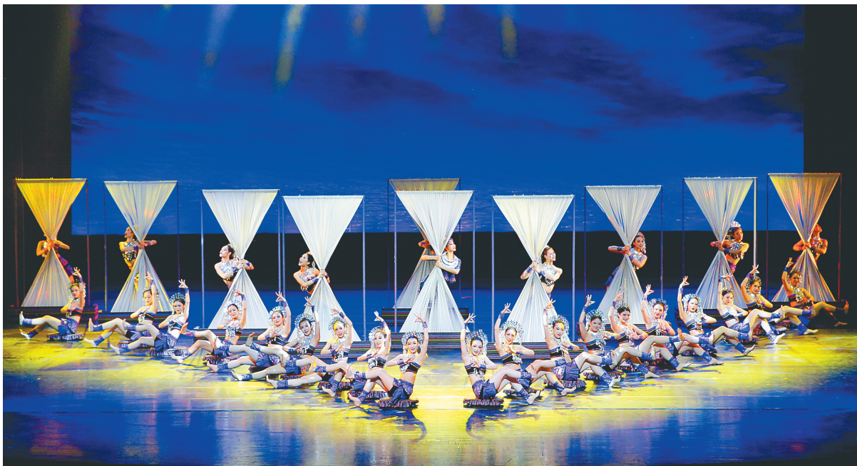
《黎族家园》在上海演出现场。

《黎族家园》曾于10月19日亮相上海上音歌剧院，彼时沪琼两地党政主要领导、上海文艺界人士及多所高校师生观看了演出，并引发《解放日报》《文汇报》《新民晚报》等主流媒体竞相报道，使该剧目在上海知名度大大提升。如今《黎族家园》重返上海展演，同时推出全场80元的“优惠票”，吸引了更多沪上观众到场体验。