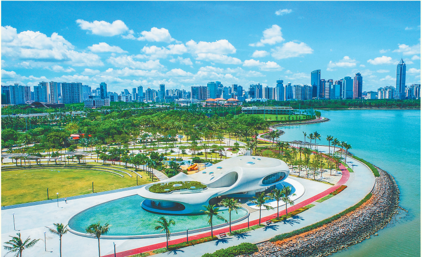
位于海口湾畔的云洞图书馆。