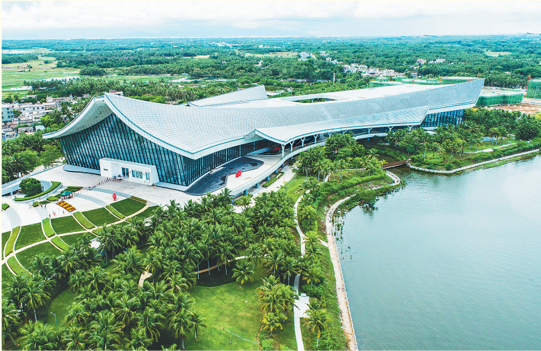
航拍中国(海南)南海博物馆。

《南海人文历史陈列》《南海自然生态陈列》,《八百年守候——西沙华光礁I号沉船特展》等专题展