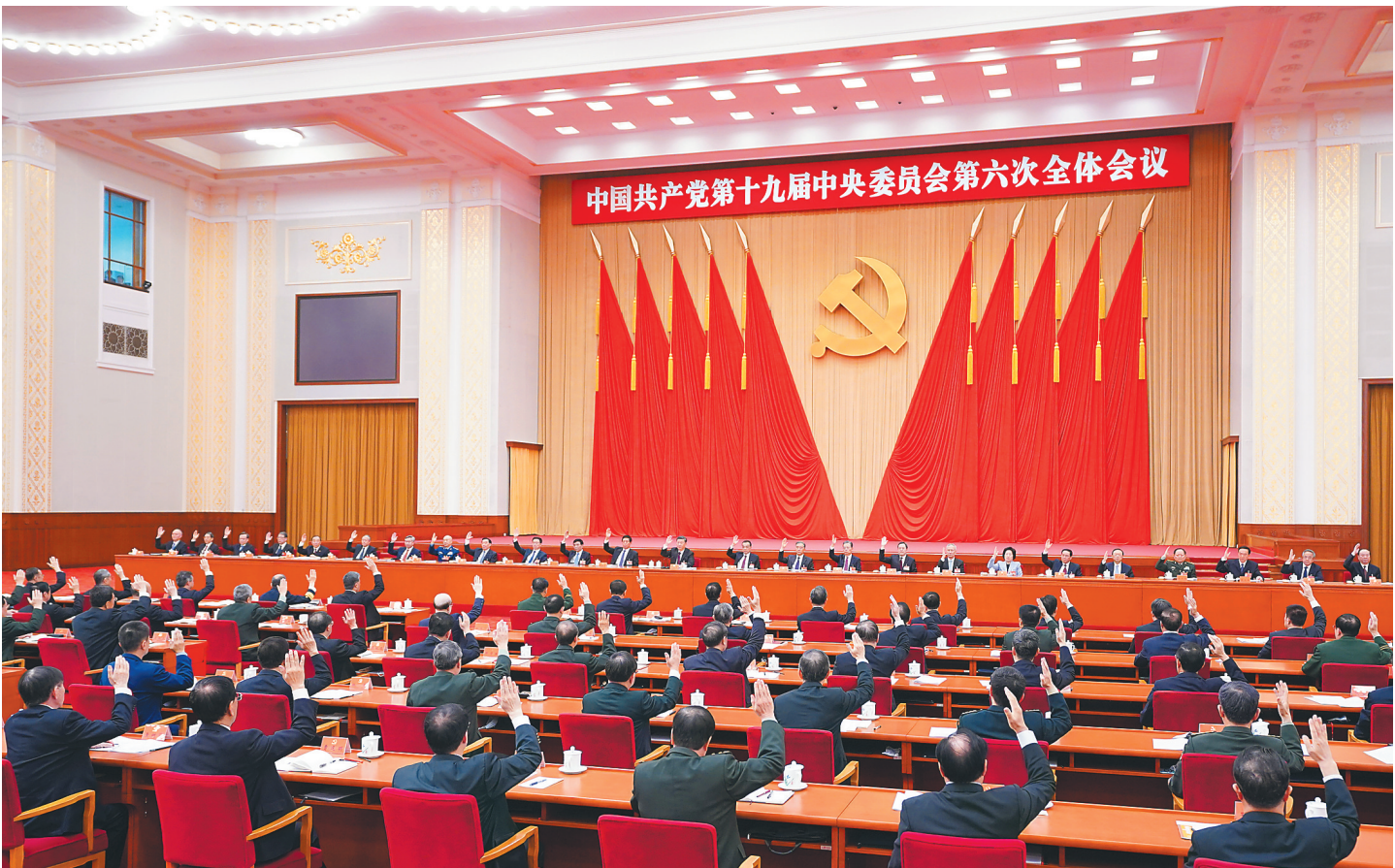
中国共产党第十九届中央委员会第六次全体会议,于2021年11月8日至11日在北京举行。中央政治局主持会议。新华社记者 燕雁 摄