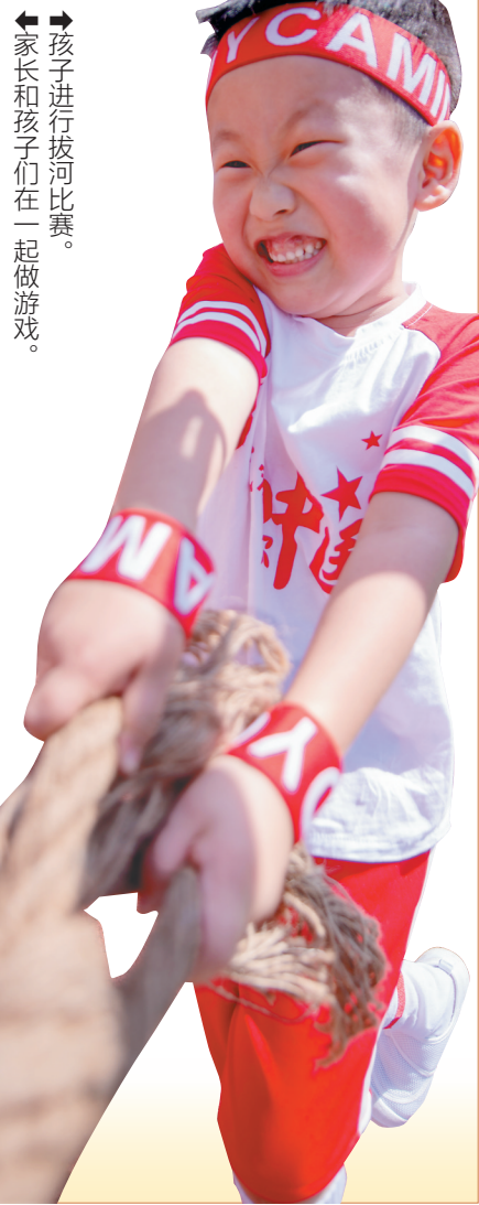
孩子进行拔河比赛。家长和孩子们在一起做游戏。

11月13日，在海口跨世纪成龙幼儿园秋季“健康快乐”亲子运动会上，家长和孩子们一同体验运动的快乐，加深彼此的情感交流。据了解，该园还引导孩子们对游戏进行记录与分享，提高幼儿在游戏中的学习能力。