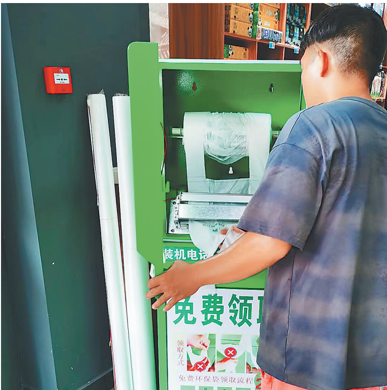
群众扫码后领取环保袋。

本报讯（记者李艳玫）日前，由三亚市旅游和文化广电体育局提出立项、海南省旅游和文化广电体育厅归口管理、海南省市场监督管理局发布的《非公路用旅游观光车安全管理与服务规范》（以下简称《规范》）正式实施。