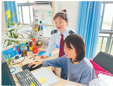
琼海市税务局税务干部辅导纳税人通过电子税务局进行申报。