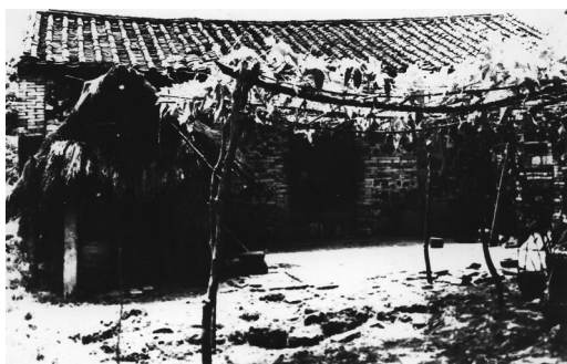
位于六连岭革命根据地的中共万宁县委机关旧址。资料图