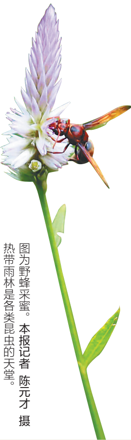
图为野蜂采蜜。

热带雨林被誉为“地球之肺”，霸王岭林区是海南热带雨林的典型代表，气候温和，雨量充沛，动植物种类繁多，生态系统完整，生态功能齐全，具有典型性、独特性、珍稀性、多样性四大特征，分布有野生植物2213种，野生动物365种。其中独有的海南长臂猿是全球现有灵长类动物中数量最少、极度濒危的物种。经过数十年的精心保护，霸王岭的生态环境恢复良好，生活在霸王岭的海南长臂猿近年来生存数量稳步增加，目前，已增加至5群共35只。