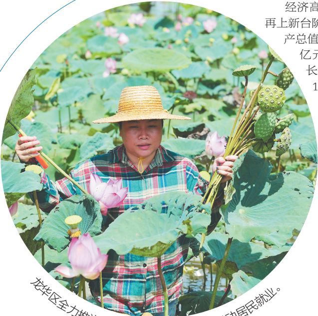
龙华区全力推进乡村振兴,发展乡村产业带动居民就业。