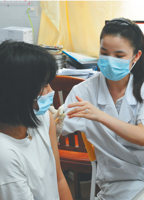
龙华区推进新冠疫苗接种,构建全民防疫屏障。

城乡居民福祉得到新提升。常住人口城镇化率达到90%,城市更安全、更宜居、更韧性、更智能。城镇居民人均可支配收入年均增长10%以上,城镇登记失业率3%以内;每千人拥有执业(助理)医师达到4.5人,人均预期寿命达到81岁。义务教育由基本均衡迈向优质均衡,公共