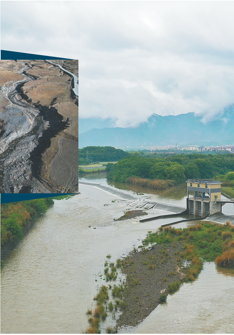
这是入选2021年度世界灌溉工程遗产名录的江西潦河灌区。

据不完全统计，萨迦灌区仍有400多个蓄水池在发挥作用，灌溉着河谷平原约10万亩的青稞产区，助力日喀则发展成为“世界青稞之乡”。