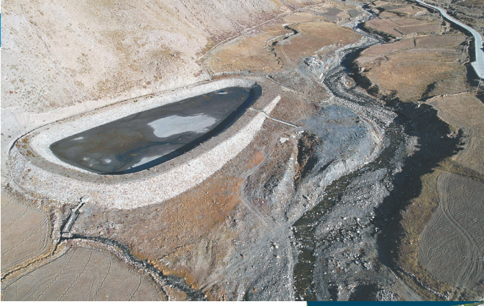
这是入选2021年度世界灌溉工程遗产名录的西藏萨迦古代蓄水灌溉系统。

本次里运河-高邮灌区和萨迦古代蓄水灌溉系统申报世界灌溉工程遗产技术支撑团队负责人、浙江水利水电学院教授刘学应说，里运河-高邮灌区治水理念科学、工程布局完善、建造工艺先进。它的先进性，体现在修筑堤堰调节运河水位，形成了“防不足，泄有余”的治水理念，也体现在利用水闸、水洞、水关、水坝灌溉调水通道，通过支斗渠三级配水网络实现灌溉，形成了完善的灌溉用水体系，实现了调节旱涝的水位平衡，兼顾了灌溉和漕运的功能平衡。