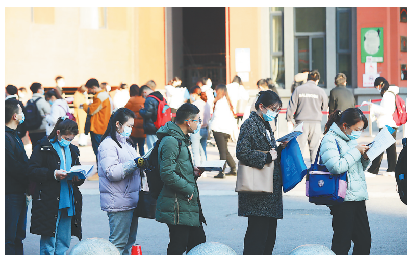
11月28日,在位于合肥市的安徽考区45中橡树湾校区考点,考生在等候进场时复习。

斜。安排2.1万个计划专门招录应届毕业生,服务和促进高校毕业生就业工作。坚持基层导向,有8700余个计划补充到西部和艰苦边远地区县(区)级及以下直属机构,并采取适当降低学历要求、放宽专业条件、不限制工作年限和经历等措施降低进入门槛,设置2800余个计划定向招录服务基层项目人员在军队服役5年以上的高校毕业生退役士兵,鼓励引导人才向艰苦边远地区和基层一线流动。