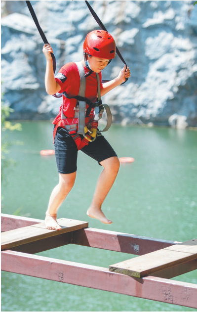
儋州石花水洞地质公园，一名男孩在体验“步步惊心”项目。

溶洞，是珍稀的地质遗迹，也是珍贵的景观资源。位于儋州市的石花水洞享有“南国奇洞”和“神奇的地下艺术宫殿”之美誉，洞内的“一石二花”（卷曲石、文石花、方解石晶花）全国罕见，不仅吸引全国各地的专家学者前往开展科研调查，也引来了八方游客。石花水洞究竟美在哪儿奇在哪儿？近日，海南日报记者走进这个神奇的洞穴探秘。