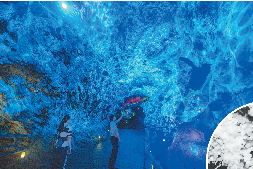
儋州石花水洞地质公园内景。