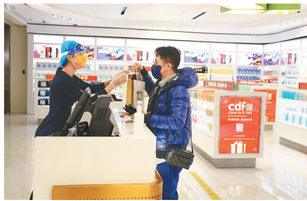
12月2日，旅客在T2航站楼免税店购物。