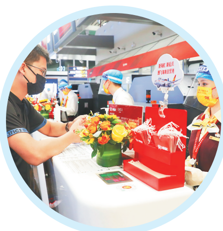
12月2日，在T2航站楼，旅客办理值机手续。