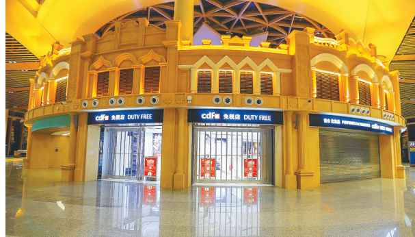
T2航站楼内的骑楼商业区。