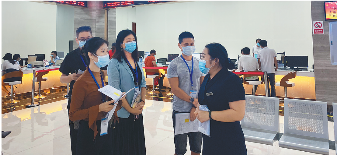
澄迈县营商环境体验员，在该县政务服务大厅进行线下体验“走流程”活动。