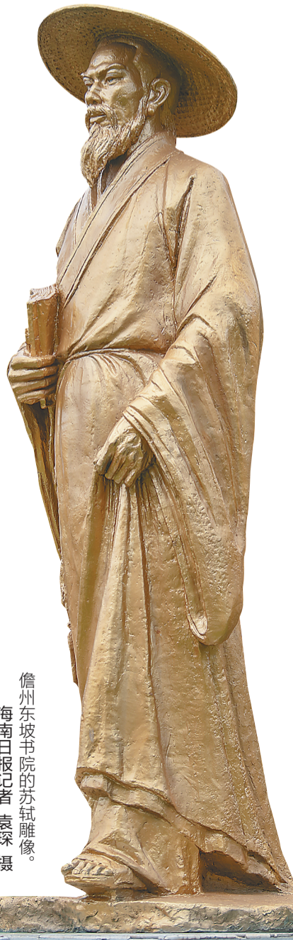
儋州东坡书院的苏轼雕像。

“琼粤两省可通过文娱融合发展，推出一程多站国际旅游路线，打造世界级旅游目的地品牌。”刘伟建议，双方应以地域文化为依托，求同存异、发挥所长，利用彼此文化的差异性和互补性，形成新的文化理念，让建构与发展中华文化国际传播平台成为琼粤文化合作路径创新工作的重中之重。