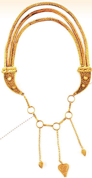
船出水的金器。 广东「南海I号」沉