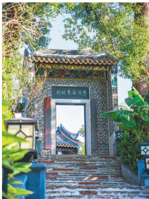
广东惠州苏东坡祠。