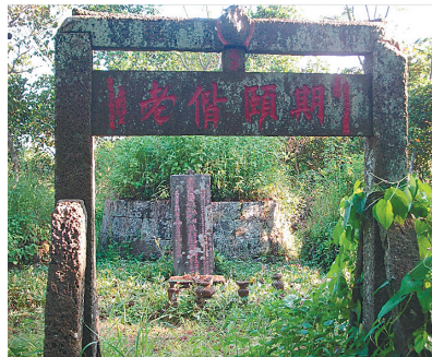
海口市雅文村的期颐偕老坊。 (本版图片均为资料图)