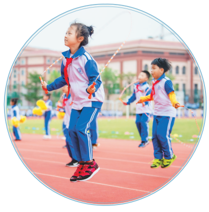
清华附中文昌学校的学生在上趣味体育课。

黄海波举例,今年9月起,海口市港湾幼儿园正式托管保亭保城镇中心幼儿园,选派了由1名园长、1名副园长、1名中层管理人员组成的管理团队来开展日常工作。通过输出优质办园理念、管理模式、最新课程实践成果,以及定期选派教育教学专家实地指导办园等多种途径,让两园充分共享教育成果与优秀师资。