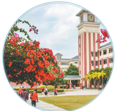
西南大学临高实验中学。