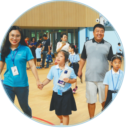
在海南生态软件园iSchool微城未来学校,家长、老师牵着孩子入学。